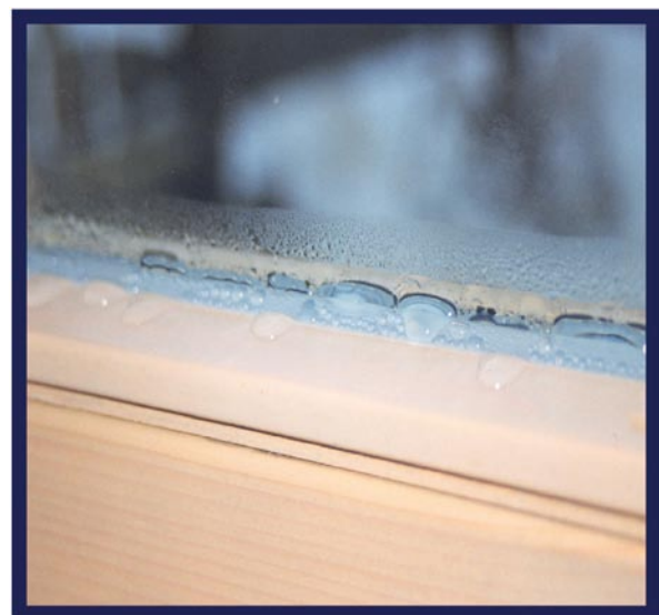
Bild 2 Tauwasserbildung am Glasrand

Bei unklaren oder fehlenden Regelungen ist Aufklärung und Beratung umso bedeutungsvoller. Dies ist beim Tauwasser- und Schimmelkriterium ähnlich wie beim sommerlichen Wärmeschutz. Der Kunde/Auftraggeber sollte bei diesen für ihn so wichtigen Bauteileigenschaften Alternativen zu den Standardlösungen, über deren Zeitgemäßheit man unterschiedlicher Meinung sein kann, aufgezeigt bekommen.